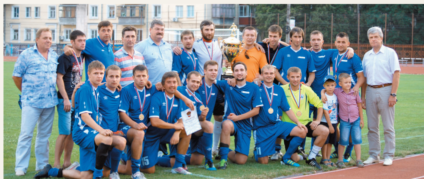
Команда «Курскэнерго» – чемпион Курской области по футболу 2014 года