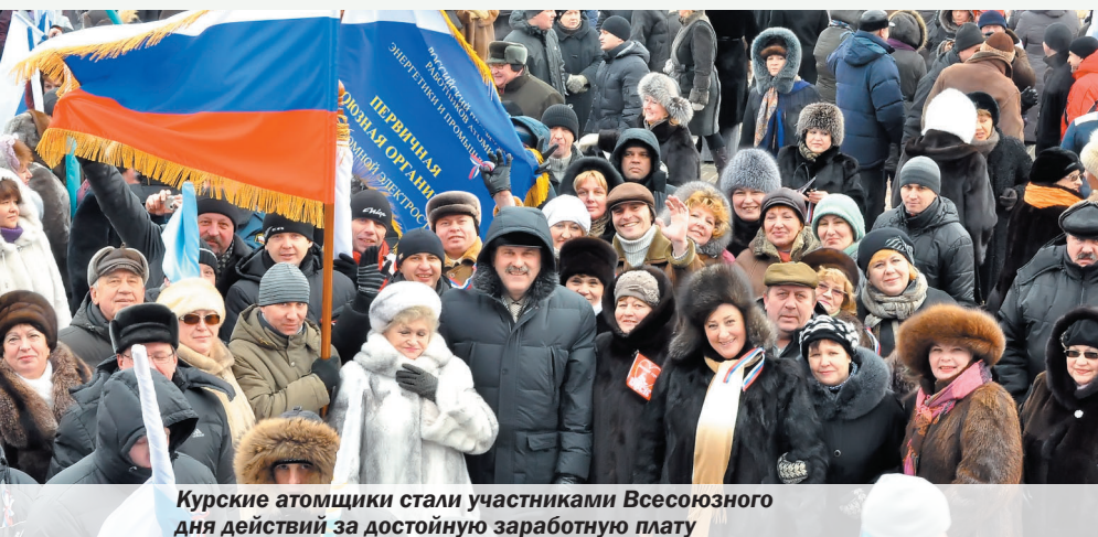
Курские атомщики стали участниками Всесоюзного дня действий за достойную заработную плату